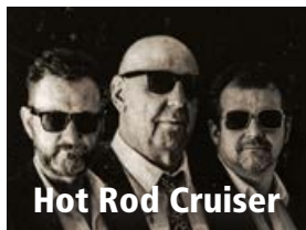
Hot Rod Cruiser